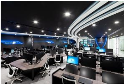
遠隔監視・運転支援エリア

A.I/TEC は、「遠隔監視・運転支援」「IoT/ビッグデータ、AI (人工知能) の開発拠点」「開かれた共創空間」の 3 つのサービスを提供します。