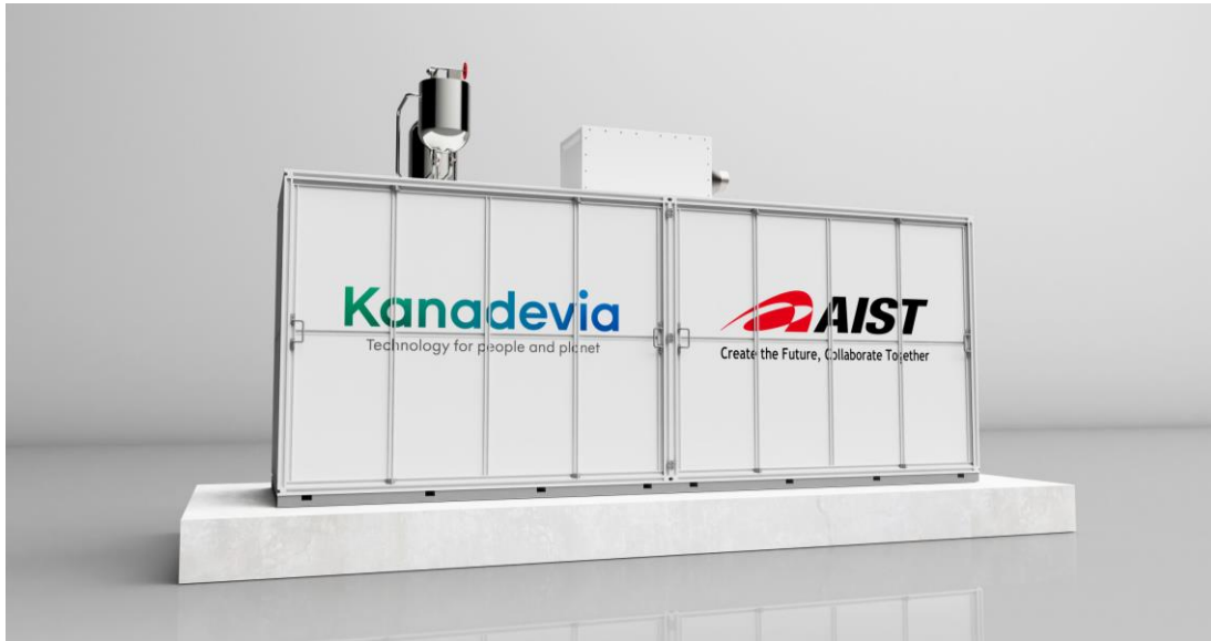
【実証実験用の装置】

カナデビアは、クリーンエネルギー技術を通じ、SDGs（国連サミットで採択された持続可能な開発目標）の達成や世界の環境問題解決に積極的に取り組んでいます。その一環として、カナデビアと産総研は、2023年4月に両者の名を冠した「カナデビア-産総研 循環型クリーンエネルギー創出連携研究室 ※1 」を設立し、研究を進めてきました。